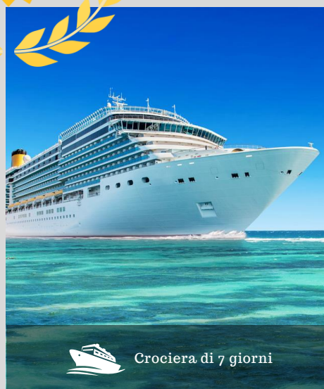
Crociera di 7 giorni